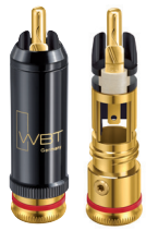
nextgen™ WBT-0102 Cu | Ag