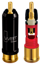
nextgen™ WBT-0110 Cu | Ag