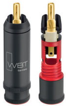
nextgen™ WBT-0114 Cu