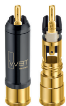
nextgen™ WBT-0152 Cu | Ag